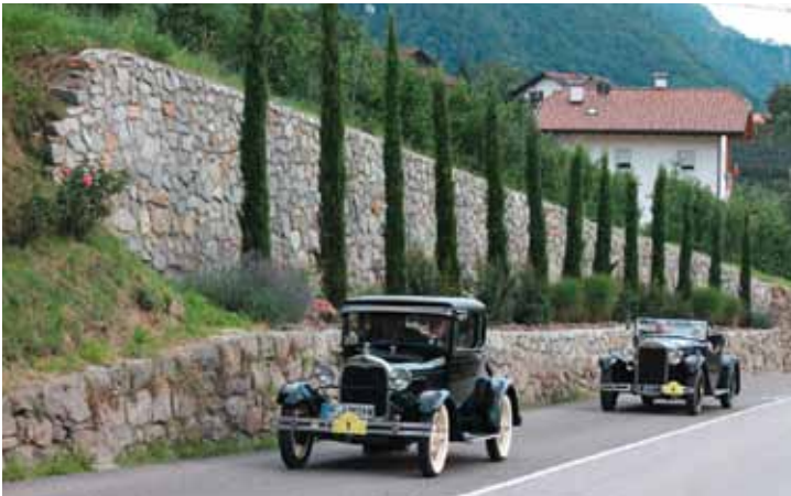
„Südtirol Classic“-Teilnehmer bei der alljährlichen „Dolomitenfahrt“

Bentley Blower am Jaufenpass, Mercedes 190 SL vor den Geislerspitzen, Riley Racing im Sarntal: Während der 28. „Südtirol Classic“ vom 7. bis 14. Juli fahren die Teilnehmer wieder entlang der schönsten Panorama-Strecken Südtirols. Start und Ziel der reizvollen Tagesetappen ist jeweils die Gemeinde Schenna. Dort bietet sich Urlaubern ausreichend Gelegenheit, die röhrenden Raritäten genau unter die Lupe zu nehmen. Ein begleitendes Kulturprogramm und Klassiker zum Mieten runden die Oldtimer-Rallye ab.