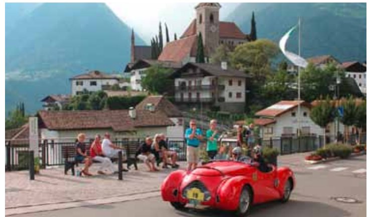
Schaufahren durchs Zentrum von Schenna bei der „Südtirol Classic“