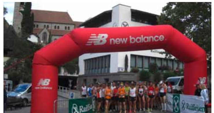
Am Sonntag, 2. September 2012 erfolgt auf der Dorfbrücke von Schenna der Start für den VII. Internationalen Berglauf Schenna - Meran 2000

Auskunft und Anmeldung: www.telmekomteam.com - berglaufmeran2000@schenna.com