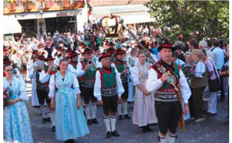
Der traditionelle Festumzug der Schützenkompanie Schenna lockt stets zahlreiche Zuschauer an. Heuer findet das Herbstfest am 14. und 15. September statt. Mit dabei ist auch die Musikkapelle Schenna.

Angebote sind für Schenna zu einer festen Einrichtung geworden. Dennoch bleibt die Hauptattraktion von Schenna das umfangreiche Wanderangebot zwischen dem Hirzgebiet, Schennaberg und Hafling/Meran 2000. Weitere Informationen zum Wanderangebot finden Sie im Info-Heft 2013, unter www.schenna.com und natürlich informieren Sie die Mitarbeiterinnen gerne im Tourismusbüro über die aktuellen Highlights.