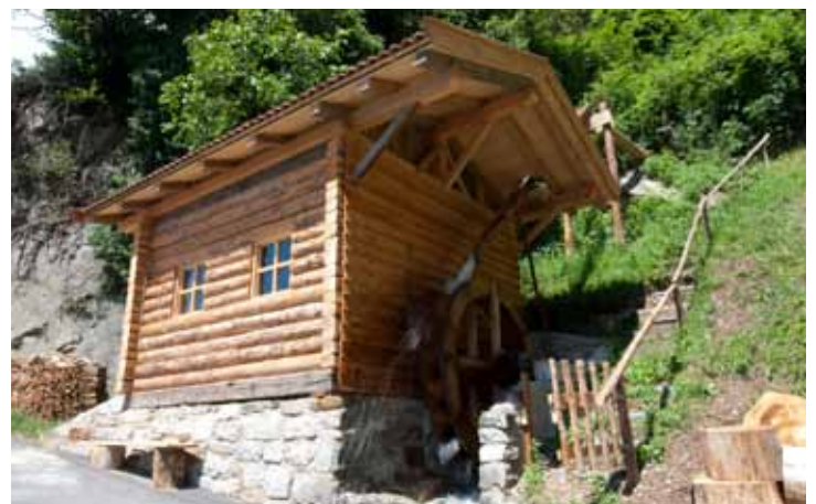
In den vergangenen Jahren wurden zwei Mühlen renoviert und in Gang gesetzt: die Tommele-Mühle in Tall und die Nunnemair-Mostrager-Mühle am Gsteirerweg. Die Tommele-Mühle kann bei der Wanderung „Leben und Arbeiten am Bergbauernhof“ und die Mühle in St. Georgen bei der Natur- und Kulturwanderung besichtigt werden