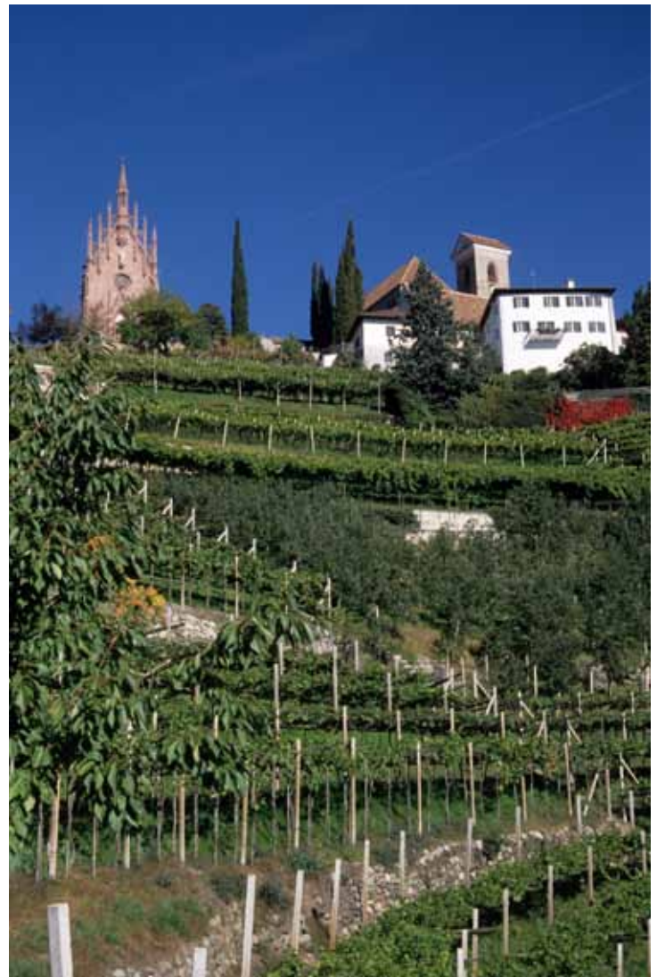
Der Kirchenhügel von Schenna mit Mausoleum

Von 25. März bis 2. November täglich von 10 bis 11.30 Uhr und von 15 bis 16.30 Uhr, an Sonntagen und zu Allerheiligen geschlossen, Änderungen vorbehalten. Das Entgelt von 2,00 € dient ausschließlich der Erhaltung und Führung des Mausoleums.