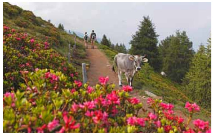
Das Wandergebiet Schenna bietet den Wanderfreunden über 200 km Wanderwege in allen Höhenlagen, markiert und gut beschildert