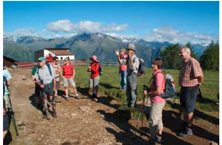
Jeden Donnerstag organisiert der Tourismusverein Schenna eine geführte Wanderung in die Südtiroler Bergwelt

Dieses Programm wird selbstverständlich von Mitte März bis Anfang November mit kulturellen Veranstaltungen wie Gästebegrüßungen und Dorfführungen durch Schenna ergänzt. Neben den geführten Wanderungen in die Südtiroler Bergwelt werden auch Erkundungswanderungen am Bergbauernhof, Höfewanderungen , Kneippwanderungen am Waalweg und Natur- und Kulturwanderungen bis zum botanischen Landesgarten „Schloss Trauttmansdorff“ angeboten. Die 14-tägigen Apfelführungen und die anschließende Apfelverkostung im Vereinshaus bzw. die Besichtigung und Führung in der Obstgenossenschaft CAFA erfreuen sich wie immer großer Beliebtheit. Gut angenommen werden auch die Weinlehrpfade mit einer gemütlichen Weinverkostung in einem Bauernkeller