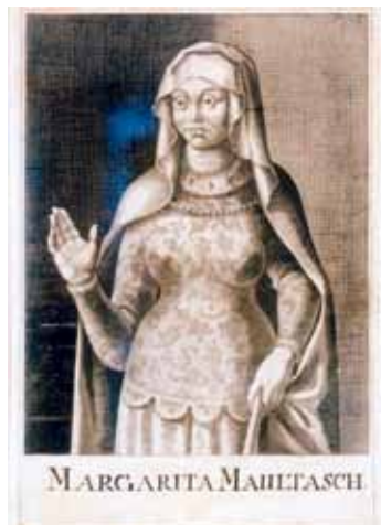
Nach dem Tod ihres Sohnes Meinhard III. und durch einen Vertrag aus 1363 kam Tirol vor 650 Jahren an das Habsburger Österreich – ungeteilter Weise bis 1918.

und besichtigen Sie also das Mausoleum, nehmen Sie sich Zeit, all die architektonischen und kunsthandwerklichen Besonderheiten eingehend zu betrachten, lassen Sie sich vom „guten Geist des Mausoleums, Karl Rinner, informieren, lassen Sie die beruhigende Atmosphäre auf sich wirken, verweilen Sie in eigenen Gedanken, in Meditation oder Gebet.