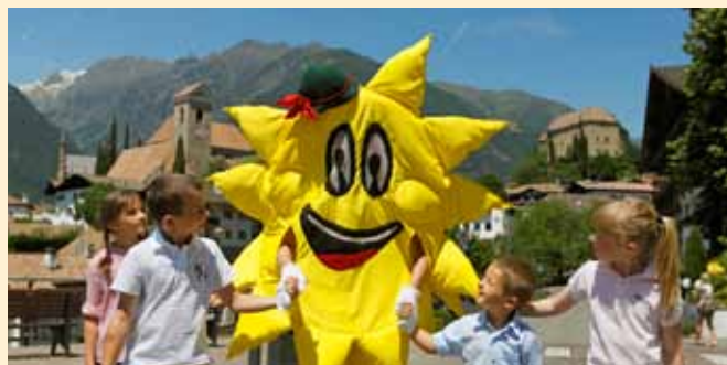
Das Kindermaskottchen „Sunny“