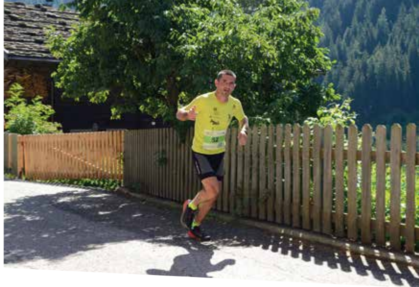
Foto: TuGA GmbH, Fotogruppe Ulten, Oswald Breitenberger www.fotokofler.com, Florian Andergassen Layout: www.lanarepro.com

Veranstalter /Organizzatori: ASV Telmekom Team Südtirol, Tourismusgenossenschaft Ultental/ Proveis / Ufficio turistico Val d'Ultimo/Proveis